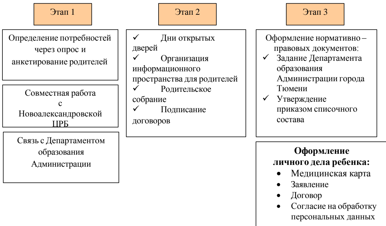
Рис. 3. «Этапы организации детей КМП»

С целью изучения степени удовлетворенности родителей качеством образовательных услуг консультационно – методического пункта, предоставляемых дошкольным образовательным учреждением, условиями пребывания их детей в детском саду, с целью выявления мнения родителей о получении образовательных услуг, а также возможные пожелания предусмотрено проведение социологического исследования удовлетворенности родителей качеством услуг консультационно – методического пункта, предоставляемых образовательным учреждением в периодичности 1 раз в квартал средствами анкетирования.